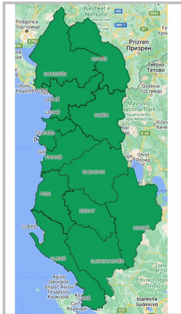
RREZIKU MAKSIMAL I QARKUT për sot dhe nesër, dt. 17 – 18.